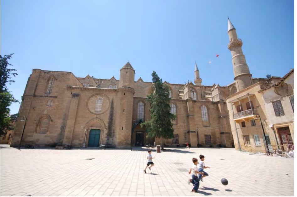
Selimiye Camii ve Eski Selimiye Medresesi'nin Olduğu Alan