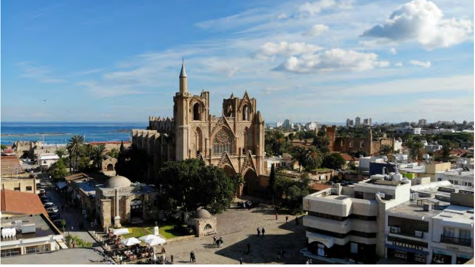
Solda Mağusa Sıbyan Mektebi ve Sağda Lala Mustafa Paşa Camii