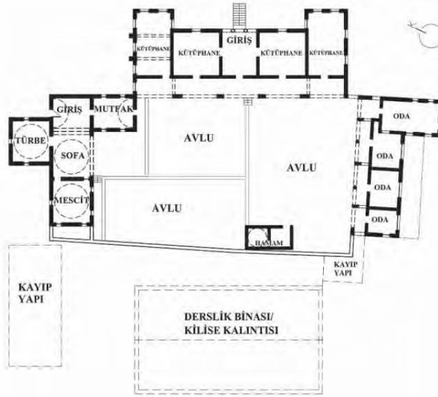
Kutup Osman Tekkesi Planı (Mustafa Eyyamoğlu) 709

dan yola çıkılarak denilebilir ki mezkûr tekke bir mevlevî tekkesi olup Kutup Osman Efendi'nin vefatından önce de sonra da burası halk tarafından biliniyordu. Ayrıca bu tekkenin yanına Kutup Osman'ın türbesi yapıldıktan sonra halk arasında bu isimle anılıp meşhur olmasından dolayı Lala Mustafa Paşa'nın yaptırdığı tekkenin ismi unutulmuştur. Ya da yukarıda verilen örneklerde görüldüğü gibi yalnızca tekke ve mevlevîhâne isimleri ile anılmasından dolayı türbe de yapıldıktan sonra buranın Kutup Osman Tekkesi şeklinde anılmaya başlaması bu isimle meşhur olmasına sebebiyet vermiştir.