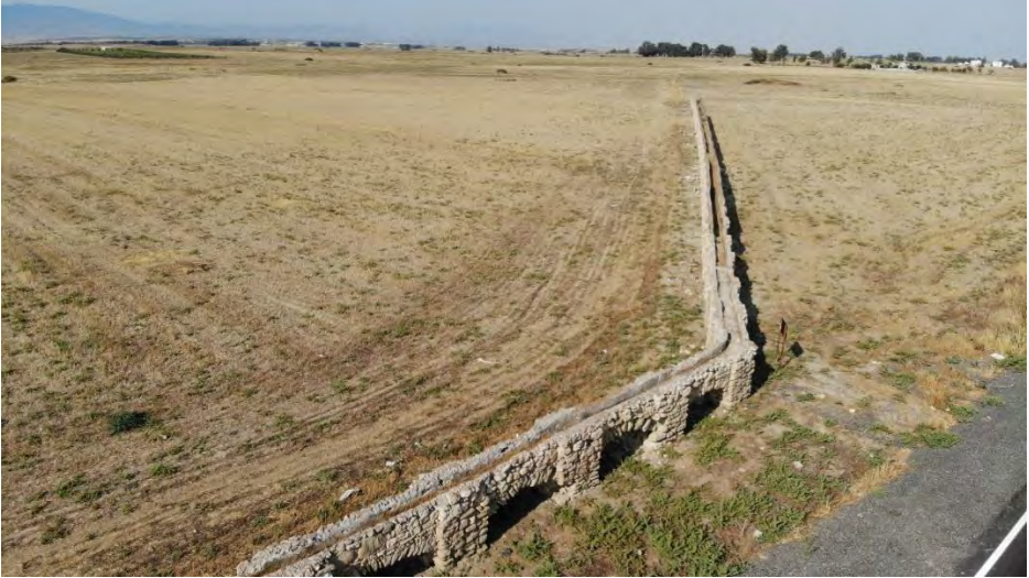
Arif Paşa Su Kemeru