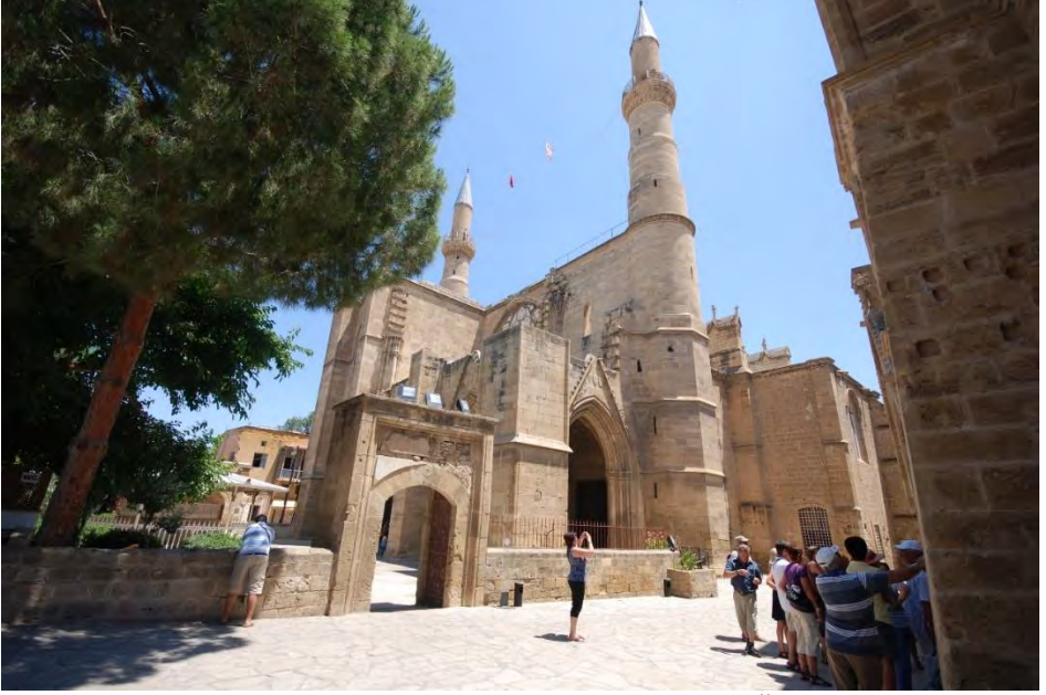
Sağda Bedesten Solda Selimiye Camii (Fevzi Üzmen Arşivi)