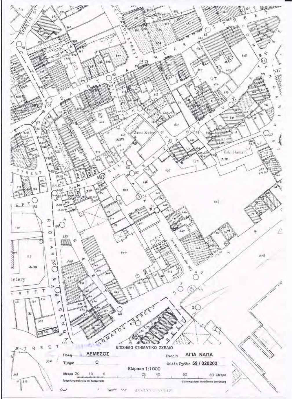
Limasol Ulu Camii ve Çevresinin Krokisi