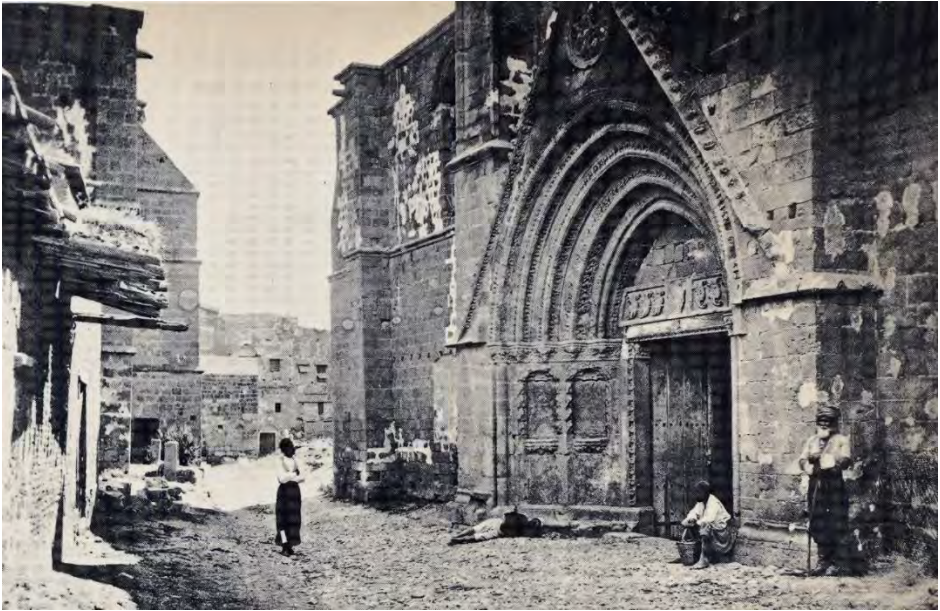
Sağda Lefkoşa Bedesten ve Solda Selimiye Camii (John Thompson 1878.)