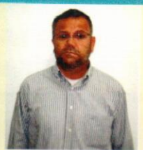
Mustafa K. Kasapoğlu 29 Mayıs